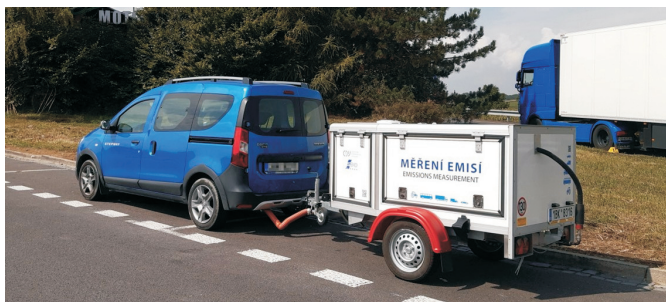
obr. 2 Mobilní měřicí zařízení

je izokineticky odebírán reprezentativní vzorek výfukových plynů pomocí patentované dvoudílné izokinetické sondy pro emisní měření.